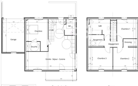
Rez de jardin Etage

Notes : Des modifications sont susceptibles d'être apportées à la plan et l'impact des nécessités techniques, administratives et/ou réglementaires. Les surfaces utiles, mesurées conformément au règlement, ne comprennent pas les surfaces des parties non habitées, garages, dépendances, porches et terrasses non aménagées. Les aspects techniques, le mobilier et les agencements ne sont pas fournis. La surface de chaque pièce est cotée avec son meilleur placard.